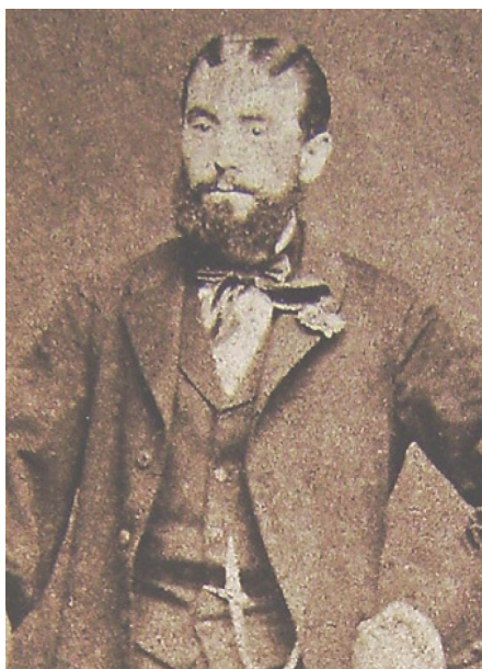
Mahunka Alajos (1822–1897) (AM)

A honfoglalás ezredéves évfordulója környékén Albertfalván több mint ötven iparos élt, „s ezek mindannyian a bútorigart űzik” – állította egy szakközlés. A mesterek évente ötszáztól kétezer forintig terjedő összeget költöttek nyersanyagok beszerzésére. Ez évi harminc-negyvenezer forintot jelentett. A célszerűség szülte a hazai viszonyok között ritka szövetkezeti formát, a nyersanyagbeszerző szövetkezetet, amely 1891. december 6-án alakult meg Albertfalván, és a Pest megyei hitelszövetkezethez tartozott. A szövetkezés gondolatát a termelők hasznát lefölöző kereskedők elleni közös fellépés is motiválta előbb a közös nyersanyag beszerzése, később a késztermékek értékesítése területén.