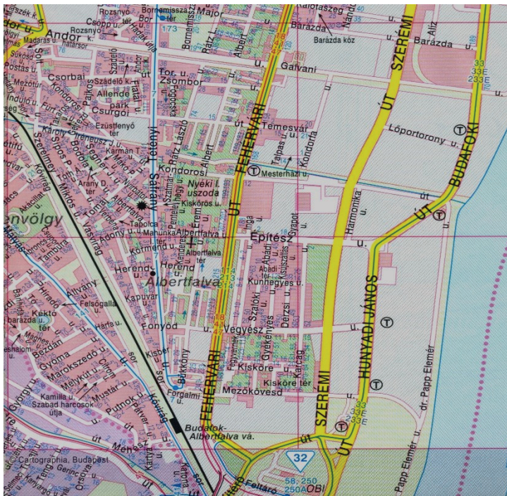
Albertfalva fő útvonalai és átmenő vasútvonala (Budapest atlasz, 2014)